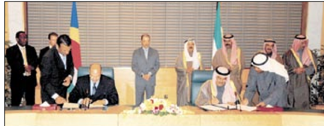
• جانب من توقيع اتفاقية منع الازدواج الضريبي

توضيحا لما جاء في بعض الصحف اليومية الكويتية بتاريخ 2008/2/5 فإنه من الثابت أن السيد / جميل السلطان لم يسبق له إستيراد أو تصدير أي بضائع باسمه الشخصي بالمنطقة التجارية الحرة ولم يسبق مطالبته بأي رسوم جمركية عن أي بضائع أو مواد تم إدخالها دولة الكويت لحسابه وإن الموضوع