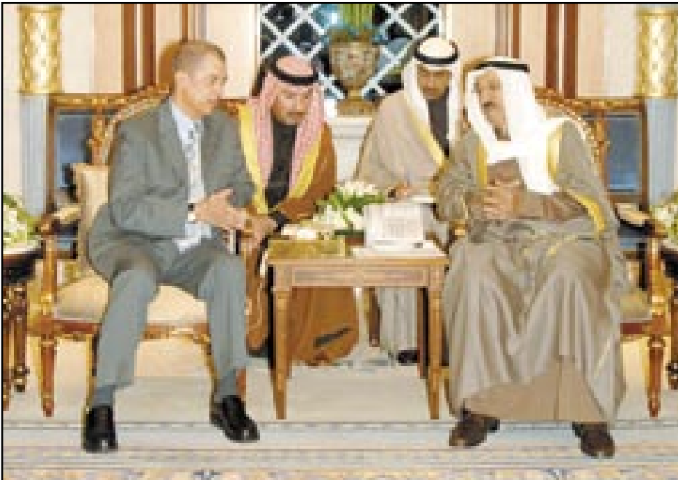
• الأمير مستقبلاً رئيس سيشل

سموه التقي ولي العهد وأولم على شرف الضيف والوفد المرافق